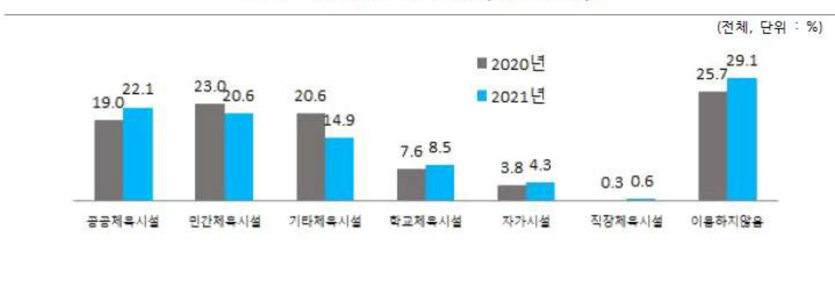
<자주 이용하는 체육시설(대상 전체)>