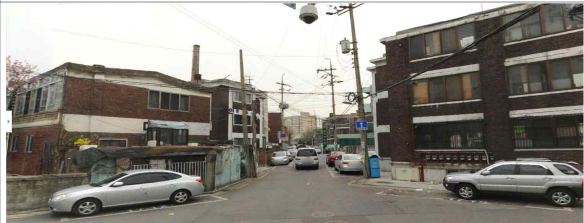
정비예정구역 내 연립주택